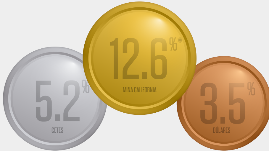
Tasa de rendimiento en los últimos 10 años